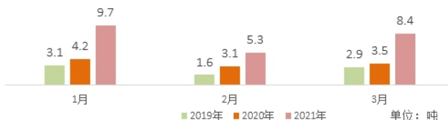
CAIQ 溯源的印度尼西亚食用燕窝出口量